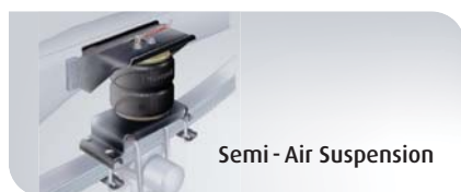
Semi - Air Suspension

Les renforts de suspension Semi-Air peuvent être installés sur la majorité des véhicules utilitaires, camping-cars, 4X4 et monospaces qu'ils soient d'origine à lames ou ressorts hélicoïdaux. Les coussins double convolute ou diaphragmes sur pistons apportent confort, anti-roulis mais aussi tenue à la charge quelques soient les conditions de route.