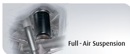
Full - Air Suspension

Les renforts de suspension Semi-Air peuvent être installés sur la majorité des véhicules utilitaires, camping-cars, 4X4 et monospaces qu'ils soient d'origine à lames ou ressorts hélicoïdaux. Les coussins double convolute ou diaphragmes sur pistons apportent confort, anti-roulis mais aussi tenue à la charge quelques soient les conditions de route.