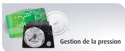
Gestion de la pression

Notre partenariat avec les meilleurs fournisseurs nous permet de proposer des solutions clé en main à nos clients quelques soient leurs besoins qu'ils soient constructeurs automobiles ou autres.